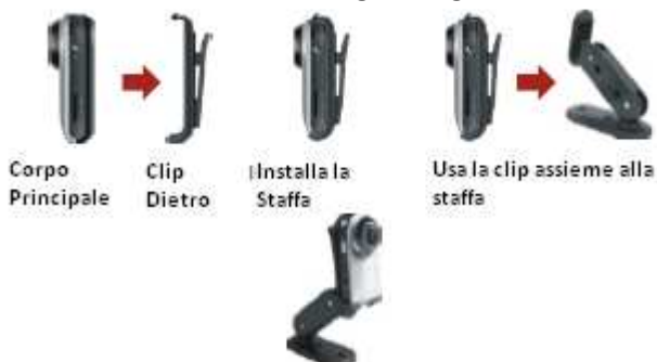
Figura di uso con Staffa

WMG SHE può essere utilizzata direttamente a mano, oppure può essere usata utilizzando la clip posta sul retro o la staffa come mostrano le figure seguenti.