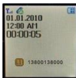
interfaccia di chiamata in arrivo