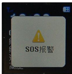
Interfaccia della richiesta SOS

Se viene impostato un numero (numero predeterminato in item3), quando si preme il tasto SOS, il terminale comporrà i tre numeri memorizzati.